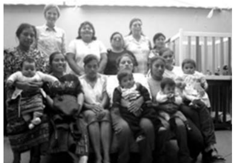
Revista Eficiencia Voces de Guatemala, publicado por Casa Xelajú.